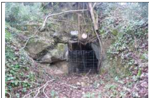
Figure 1 : Vue de l'entrée principale de la carrière prioritaire

Le propriétaire de l'accès principal de la carrière prioritaire est réticent à dépenser de l'argent public pour mettre en protection ses carrières. Il estime que la clôture et les panneaux de sensibilisation qu'il a posé suffisent à limiter la fréquentation sur le site.